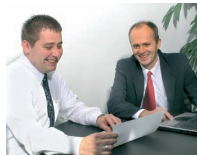
应用服务 Application service

Medium-application Compatibility Mechanics + electronics