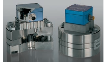
VS 系列 VS Series

Flow measurement Precision dosing Hydraulic systems Systems monitoring Open/closed loop control Process control Automobile industry Plastics technology