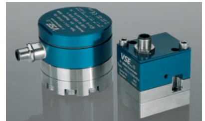
VHM 系列 VHM Series

Paints, dyes Chemicals Pharmaceuticals Two-component mixers Petrochemicals