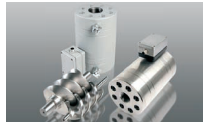
RS 系列 RS Series

Process control Hydraulic systems Highly viscous, paste-like, abrasive adhesives and sealants