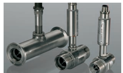
VTR 系列 VTR Series

Waterbased liquids Water Oils Petrochemicals