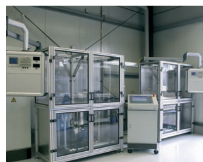
质量控制 100% 100% Quality control

Re-calibration Loan equipment 24 h service on request