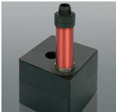
过程控制 Process Control