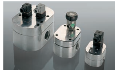
EF 系列 EF Series