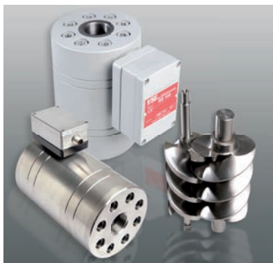
过程控制 Process Control