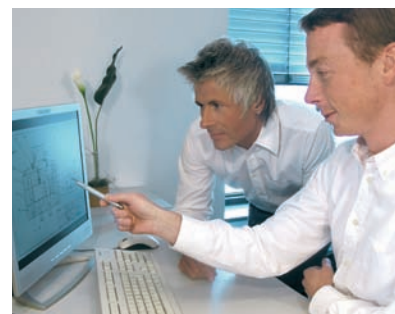
设计+开发 Construction + Development

For installation, operation and maintenance